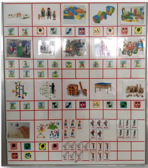
kiesbord uit een van de groepen.

Bijvoorbeeld: in de winkelhoek wordt inpakpapier aangeboden. Kinderen kunnen dan cadeautjes inpakken. Hierdoor zijn ze bezig met passen en meten en het oefenen van hun motoriek zonder dat ze dit zelf in de gaten hebben. In de huishoek liggen tijdschriften zodat kinderen in aanraking komen met letters en doen alsof ze lezen (en misschien ook letters herkennen).